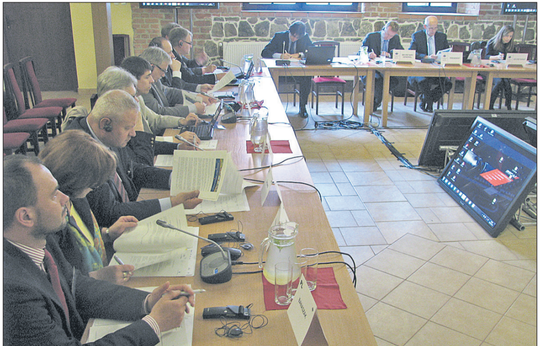
Uczestnicy seminarium w sali konferencyjnej w Zamku Bierzgłowskim

Na posiedzeniu w gminie Łubianka w dniu 15 maja 2012 roku członkowie Grupy Przymierza Europejskiego (Grupy EA) z Komitetu Regionów potwierdzili swe zaangażowanie na rzecz promowania energii odnawialnej i sporządzili niniejszą deklarację. Członkowie: