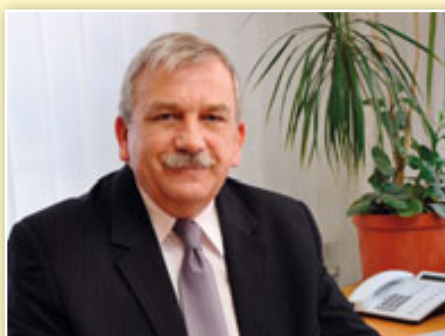
Pan Marek Tramś, Starosta Polkowicki

„ Chciałbym zwrócić uwagę kolegów z Turcji na znaczenie demokracji na poziomie obywateli i na istotną rolę, jaką odgrywają władze lokalne i regionalne we wprowadzaniu jej zasad. ”