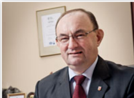
Pan Jan Bronś, Burmistrz Oleśnicy

“ Unia Europejska, która została wyjątkowo dotknięta bezprecedensowym kryzysem gospodarczym musi wypracować kompleksową strategię mającą na celu zapewnienie zrównoważonego rozwoju, nie tylko z gospodarczego punktu widzenia, lecz także pod względem społecznym i ekologicznym. ”